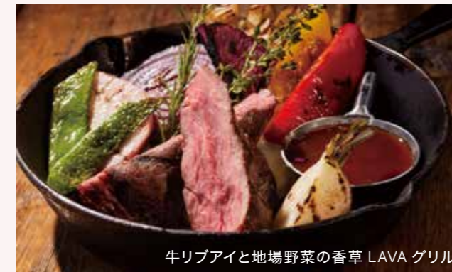
牛リブアイと地場野菜の香草 LAVA グリル

牛リブアイと地場野菜の“香草 LAVA グリル” ¥3,600 Grilled Beef Rib Eye and Local Vegetables with Herb