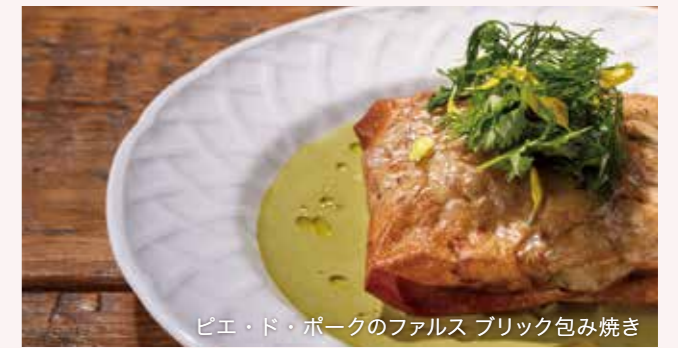
ピエ・ド・ポークのファルス ブリック包み焼き

ピエ・ド・ポークのファルス ブリック包み焼き ¥2,800 Grilled Pork Trotters Wrapped in Pate Brick