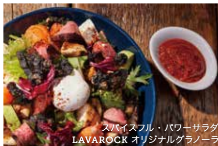
スパイスフル・パワーサラダ LAVAROCK オリジナルグラノーラ