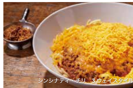
シンシナティ・チリ 3ウェイスタイル