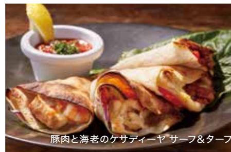
豚肉と海老のケサディーヤ サーフ&ターフ